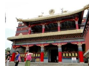
CHINA FOLK CULTURE VILLAGE