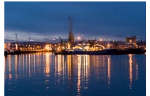
HONG KONG CITY

Hari ini, Anda kembali menuju HongKong dengan menggunakan Kereta (MTR). Setibanya di HongKong, Anda kembali ke Hotel dengan pengaturan masing-masing.